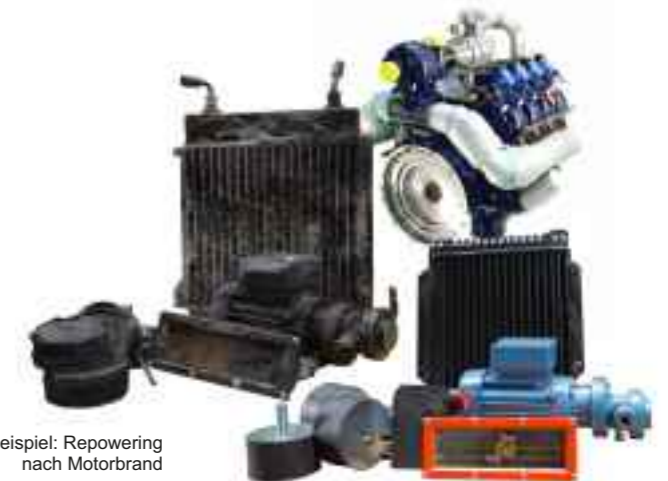
Beispiel: Repowering nach Motorbrand

Beim Repowering werden defekte oder verschlissene Teile durch neue bzw. leistungsstärkere ersetzt. Alle noch gebrauchsfähigen Komponenten werden beibehalten und überholt; so bringen Sie Ihr BHKW kostengünstig auf den neuesten Stand – sowohl ökonomisch als auch ökologisch.